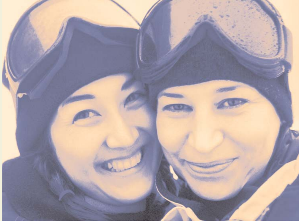
Aipatzen ez dena, hutsaren hurrena / Lo que no se nombra no existe.