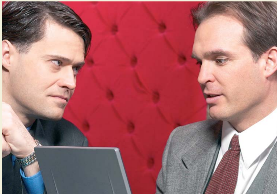
Aipatzen ez dena, hutsaren hurrena / Lo que no se nombra no existe.

“A la mujer como al pulpo, hay que atizarles para que se ablanden”.