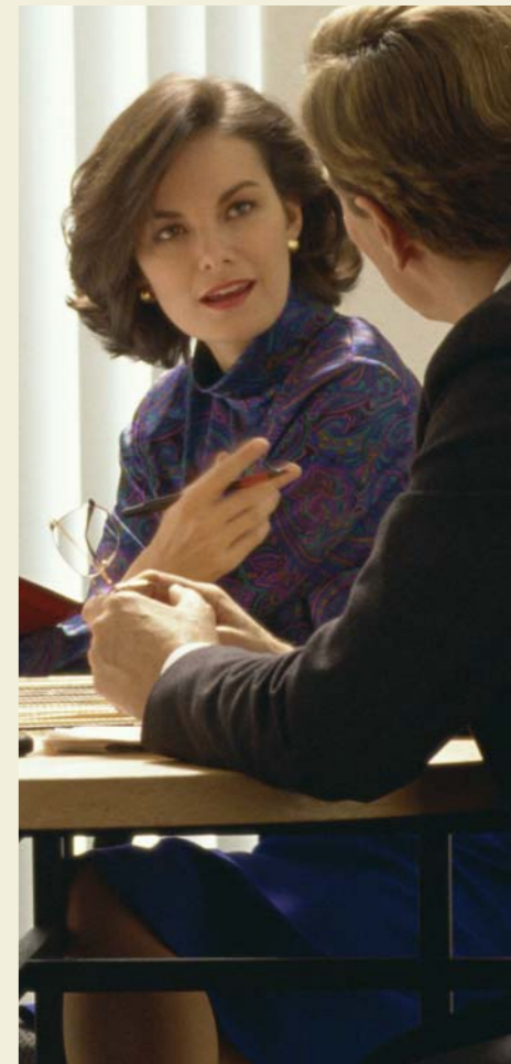
Aipatzen ez dena, hutsaren hurrena / Lo que no se nombra no existe.