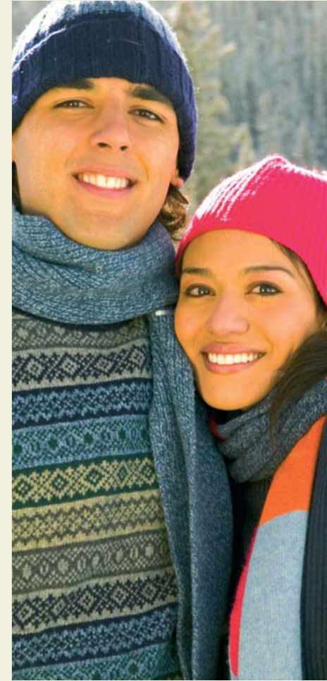
Aipatzen ez dena, hutsaren hurrena / Lo que no se nombra no existe.